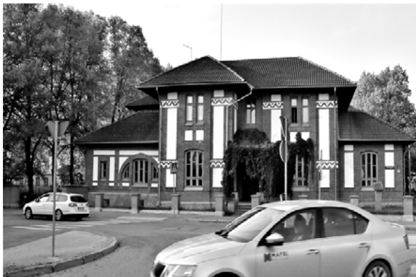
Studentkåren Eesti Üliõpilaste Seltsis hus, där fredsunderhandlingarna tog plats.