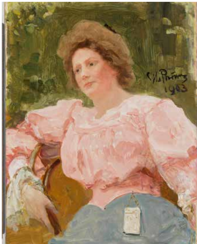
Ilya Repin 24.7.1844, Tšugujev 29.9.1930, Kuokkala nyk. Repino, Venäja Ung kvinna i rosa blus, 1903 Finlands Nationalgalleris samling / Konstmuseet Ateneum, Wäinö Wallis samling