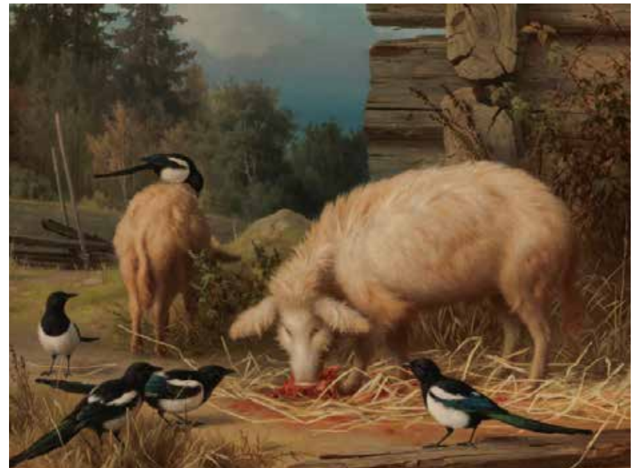
Ferdinand von Wright 19.3.1822, Haminalahti (Kuopio) 31.7.1906, Haminalahti (Kuopio) Sikoja ja harakoita, 1875 Kansallisgallerian kokoelma / Ateneumin taidemuseo

COPYRIGHT: The Presidential Office of Ukraine. All materials featured on this site are licensed under a Creative Commons Attribution-NonCommercial-NoDerivatives 4.0 International. The use of any materials posted on the website is permitted provided you link to www.president.gov.ua regardless of full or partial use of materials.