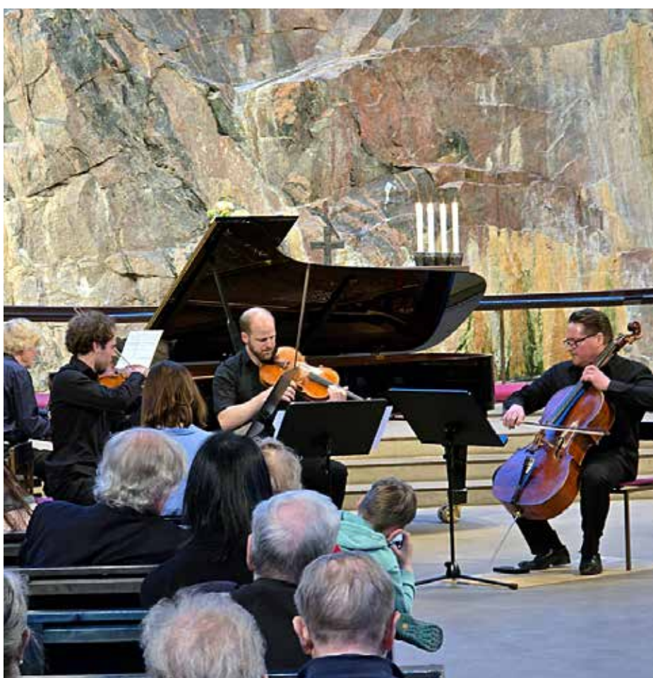
Korsholman musikkijuhlat esittäytyi Helsingin Temppeliaukion kirkossa 16.4.