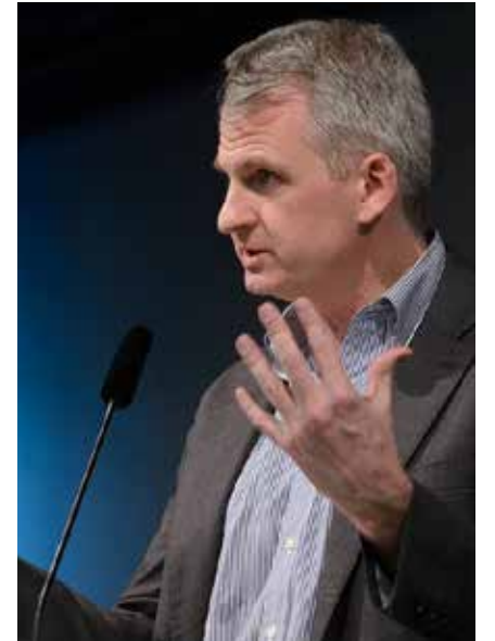
the Creative Commons Attribution-Share Alike 2.0 Generic license.

Timothy David Snyder (född 1969) är en amerikansk historiker som är specialiserad på Central- och Östeuropas, Sovjetunionens och Förintelsens historia. Han är Richard C. Levin-professor i historia vid Yale University och permanent forskare vid Institute for the Humanities i Wien