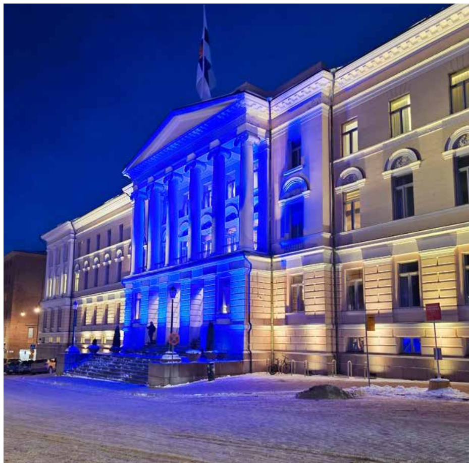
I tisdags hade Rysslands anfall mot Ukraina fortsatt i fyra år. Senatstorget i Helsingfors lystes upp i ukrainska färger.