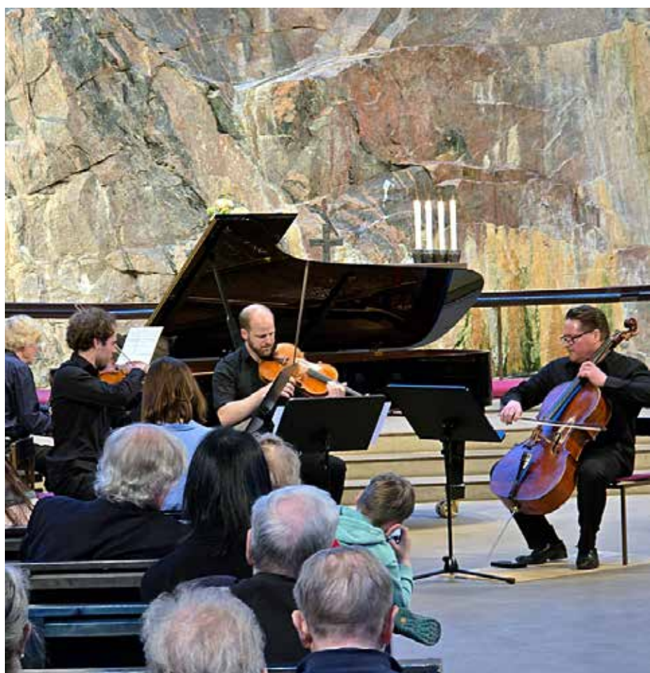
Korsholm musikfestspel uppträdde i Tempelplatsens kyrka i Helsingfors den 16 april.